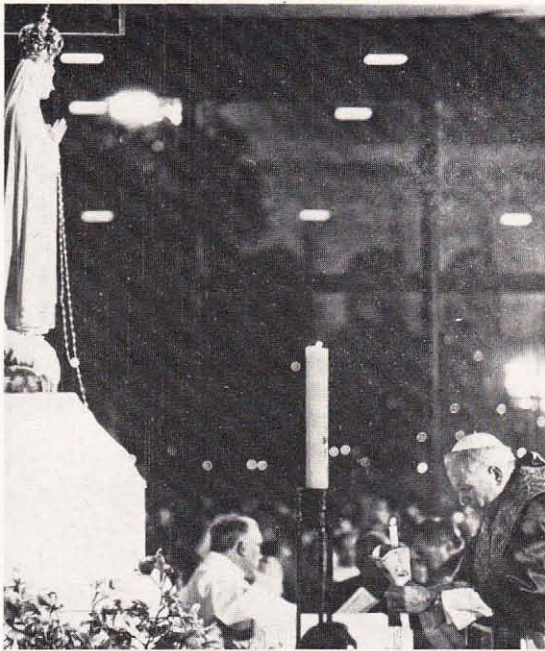
Papst Johannes Paul II. betet zum Jahrestag des Attentats am Petersplatz vor der Gnadenkapelle in Fatima (12./13. Mai 1982).