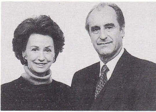
Dr. Thomas Klestil wurde am 24. Mai 1992 zu Österreichs neuem Bundespräsidenten gewählt (mit seiner Gattin und First Lady Edith-Maria). Er siegte mit nahezu 57 Prozent über seinen Mitbewerber Dr. Rudolf Streicher.